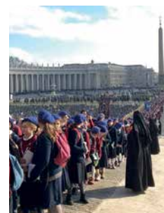
Einzug in den Petersdom