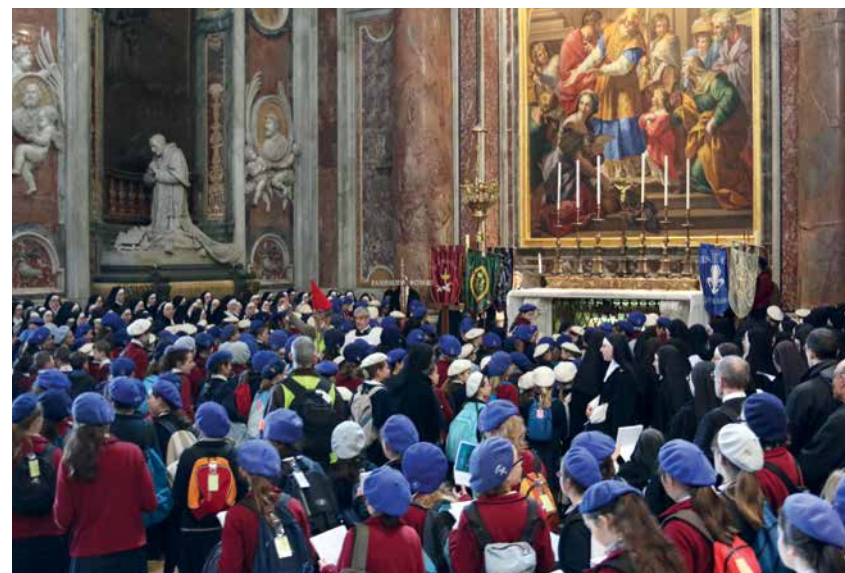
Vor dem Grab und Altar Pius X. im Petersdom

Von dem Philosophen Etienne Gilson stammen schöne Überlegungen über Dantes Denken zu diesem Thema: „Wir sind hier mitten im politischen Denken Dantes in seiner umfassendsten und philosophischen Form. (...) Dante bemühte sich sehr, eine Wahrheit aufzuzeigen, die er mit gutem Grund für original und neu hielt, die das übrigens ihrem Wesen nach heute