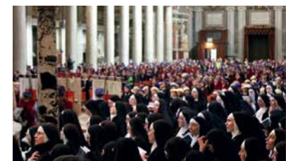
Santa Maria Maggiore war gefüllt mit den Schülerinnen und Schwestern