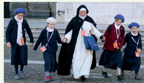
200 Schwestern widmen sich heute der Kindererziehung. 1975 waren es wenig über 20.