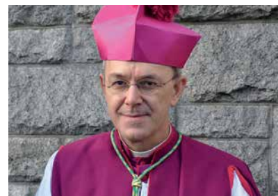
Weihbischof Athanasius Schneider besuchte das französische und das US-amerikanische Priesterseminar der Bruderschaft.

(Deutschland) besucht, wo man sich in einer Diskussion mit der Frage der lehrmäßigen Autorität des II. Vatikanischen Konzils beschäftigt.