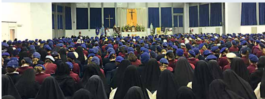
Die hl. Messe mußte jeden Tag in Rom in einem Hotelsaal gefeiert werden. Die römischen Autoritäten erlaubten die Zelebration nicht.

Die Kongregation dankt den römischen Behörden für die Erlaubnis, die Basiliken zu besuchen; sie bedauert jedoch, dass trotz wiederholter Bitten an die päpstliche Kommission Ecclesia Dei keine Kirche in Rom den Pilgern für die Zelebration der Messe zur Verfügung gestellt wurde. Alle, Ordensfrauen wie Kinder, beten dafür, dass die Kirche mit ihrer zweitausendjährigen Tradition auch wieder zu ihrer missionarischen Ausstrahlung in die Welt finde.