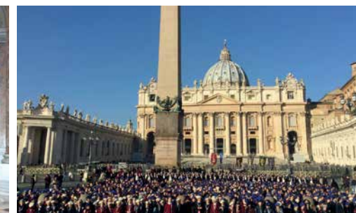
1000 Schülerinnen auf dem Petersplatz