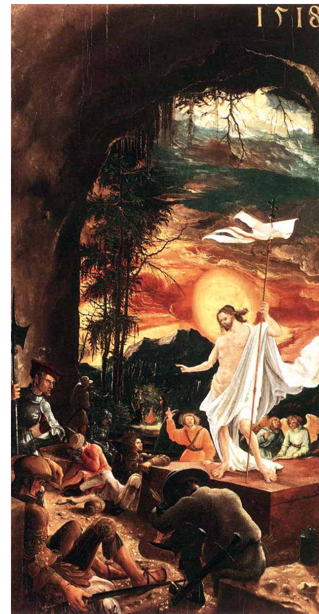
Auferstehung Christi Gemälde von Albert Altdorfer

Die Leugner der Auferstehung Christi haben sich bis heute nicht auf eine Erklärung dessen, was ihrer Ansicht nach damals wirklich geschah, einigen können. Niemand hat eine wirklich schlüssige Erklärung der Ereignisse unter der Voraussetzung, dass Jesus nicht auferstand, bieten können. Das allein zeigt bereits die Schwäche dieser Position.