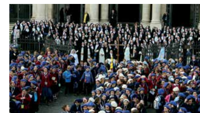
Vor der Basilika Santa Maria Maggiore