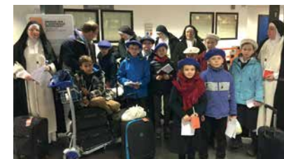
Eine Abordnung der deutschen Grundschule St. Dominikus in Rheinhauten (bei Freiburg)